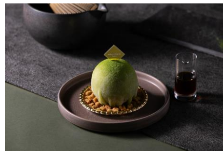
お茶丸 880円 テイクアウト 800円 (税込)

ニュースリリースに記載されている情報は発表日現在のものです。このため、時間の経過あるいは後発的なさまざまな事象によって、内容が予告なしに変更される可能性があります。あらかじめご了承ください。