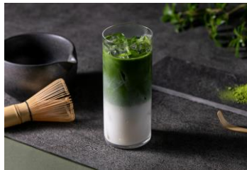
宇治抹茶ラテ 1,210円(税込)