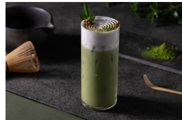
宇治抹茶ロイヤルミルクティー 1,210円(税込)