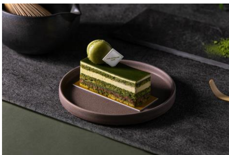
抹茶オペラ 1,100円 テイクアウト 1,000円 (税込)

抹茶本来の魅力を、異なる二つの表情で表現した限定ケーキコレクションです。緻密に計算された9層が織りなす「抹茶オペラ」は、抹茶の生地やバタークリーム、ガナッシュが重なり合う重厚な一品。玄米とフィアンティーヌの香ばしさを忍ばせ、抹茶の深い渋みを引き出した洗練された大人な味わいに仕上げました。一方で、まん丸なフォルムに遊び心を込めた「お茶丸」は、まろやかな抹茶ムースを宇治抹茶の求肥で包み込んだ一品。中から溢れ出す濃厚な抹茶蜜や黒糖クランブルのアクセントを、別添えの黒蜜と絡めてお楽しみいただけます。伝統的な美しさとモダンな楽しさ、そのコントラストをぜひお好みでご堪能ください。