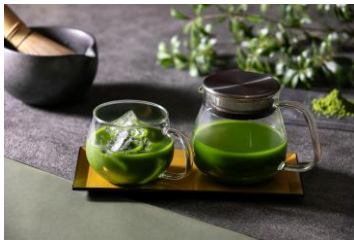
宇治抹茶100%グリーンティー 1,500円(税込)

宇治抹茶(一番茶)のみを贅沢に使用した、素材本来の味わいを楽しむ限定ドリンクをご用意いたしました。「宇治抹茶100%グリーンティー」は、抹茶本来の甘味と旨味を最大限に引き出した、清涼感あふれる一杯。暑い日に最適なスッキリとした飲み心地で、一番茶の真髄をダイレクトにご堪能いただけます。また、抹茶の濃厚な旨味をミルクが優しく包み込む「宇治抹茶ラテ」は、抹茶本来の香りを引き立てる、まろやかでクリーミーな口当たりが魅力の一杯です。さらに、宇治抹茶に華やかな香りの紅茶を合わせた「宇治抹茶ロイヤルミルクティー」も登場。抹茶の甘味の後にふわりと広がるアロマが、心地よい余韻を残します。枯山水をイメージした情緒ある佇まいは、まさに日本の伝統と現代的な感性が響き合う、本フェアを象徴する一杯です。