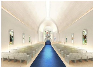
幻想的なチャペルで、新たに夫妻で 誓い合う「バウリニューアル」