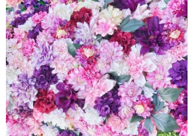
フラワーフォトスポットや、花 のプレゼントで思い出づくり

[ 開催日時 ] 2023年11月23日(祝木) 17:00~20:00 (最終受付 19:00)