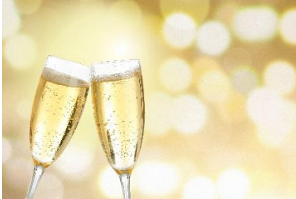
輝くイルミネーションの中で乾杯 グラスシャンパンをプレゼント

本年9月にリニューアルオープンした「アニヴェルセル 表参道」では、「いい夫妻の日」11月23日(祝木)より、イルミネーションが点灯します。イルミネーションの輝きの中でシャンパンを楽しみながら、ご夫妻と一緒に過ごしてきたことをお祝いし、普段はなかなか言えない感謝の気持ちを伝え合うひと時をお過ごしいただけます。