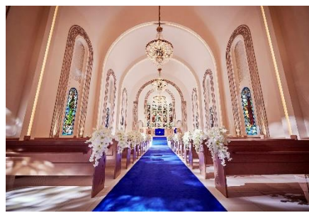
海辺のきらめきや緑に囲まれた 大聖堂で誓うバウリニューアル