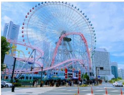
大観覧車コスモクロックで 絆を深めるひととき

さらに、当日抽選で100組200名様に、大観覧車コスモクロック21のチケットをプレゼントし、みなとみらいの景色を楽しみながら、絆を深めるひとときもご提供いたします。