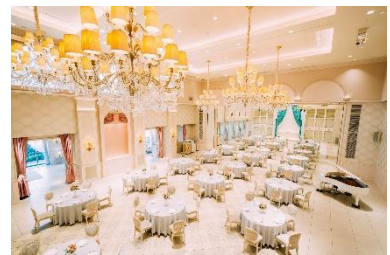
イベント・パーティ