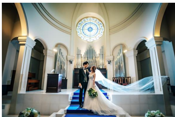
アニヴェルセル 柏

「アニヴェルセル ヒルズ横浜」 https://www.anniversaire.co.jp/wedding/yokohama/special/photowedding/